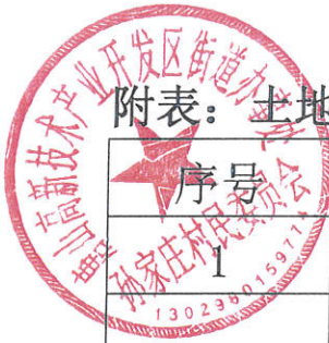
附表：土地使用情况