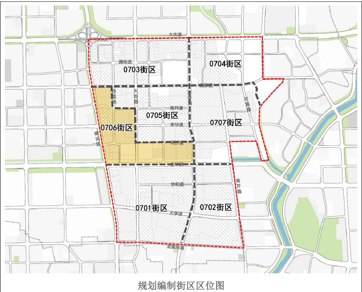
规划编制街区区位图