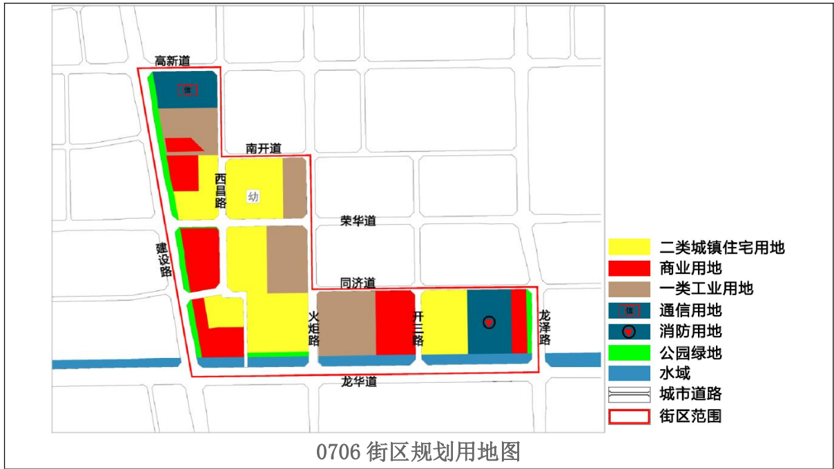
0706 街区规划要素一览表