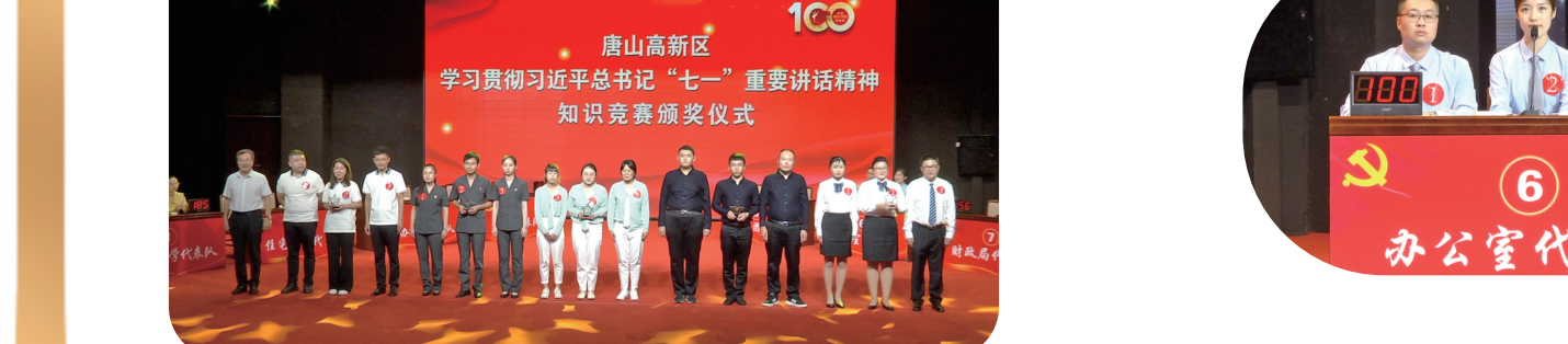
街道办事处代表队、法院代表队、城建集团代表队、住宅集团代表队、财政局代表队获得三等奖