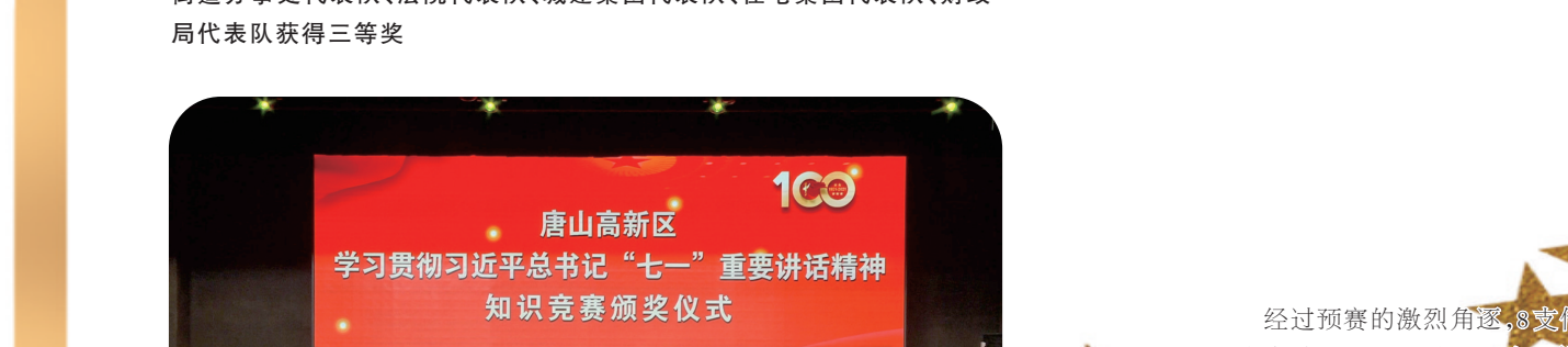
唐山高新区学习贯彻习近平总书记“七一”重要讲话精神知识竞赛颁奖仪式