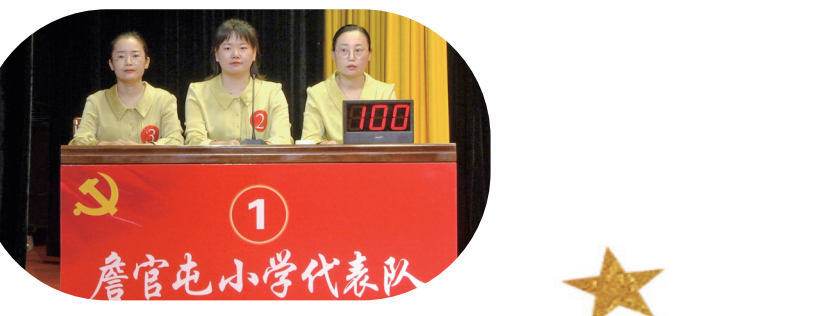
詹官屯小学代表队