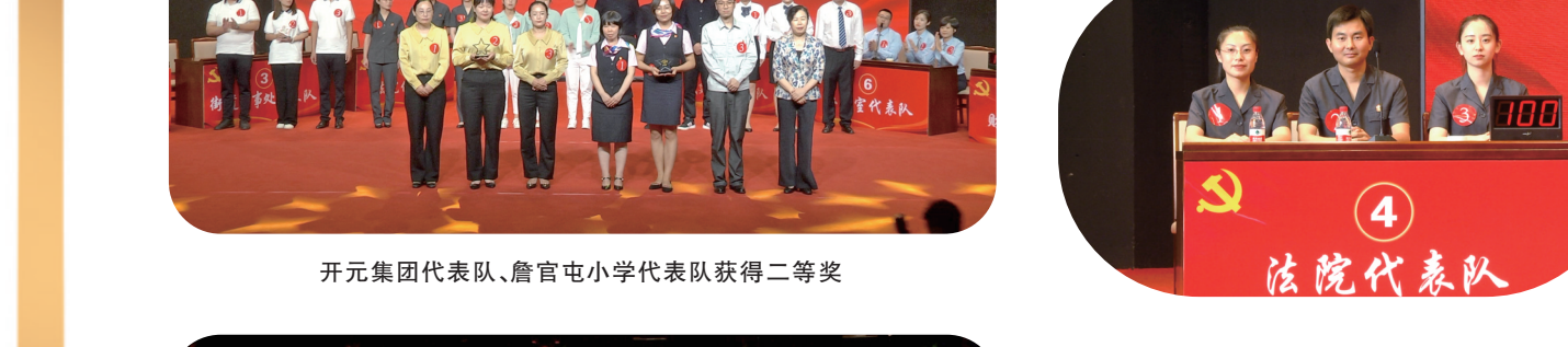
开元集团代表队、詹官屯小学代表队获得二等奖