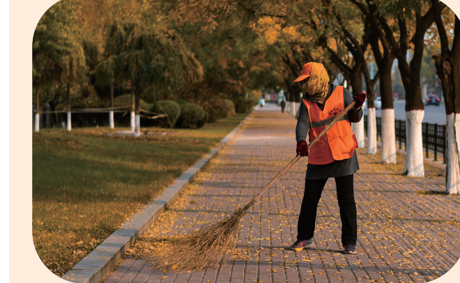
你手中扫帚磨损的速度比日子更换的还要快