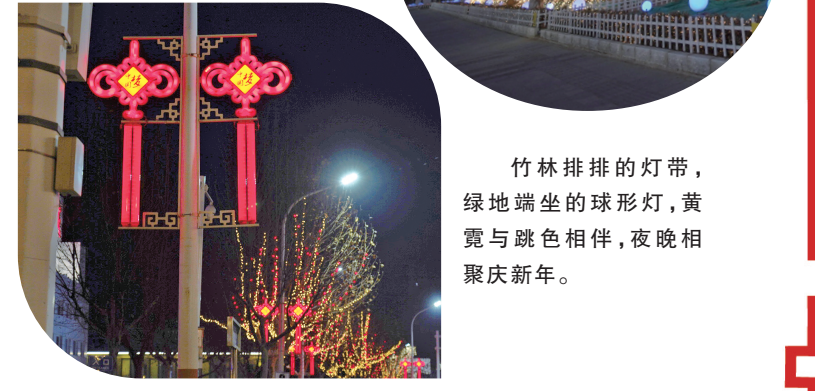
竹林排排的灯带,绿地坐落的球形灯,黄霓与跳色相伴,夜晚相聚庆新年。